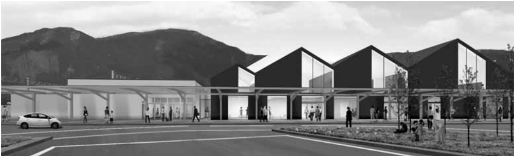
敦賀駅舎改築案の完成イメージ（7ページに詳細を掲載）