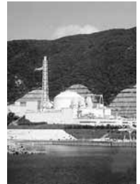
高速増殖原型炉 もんじゅ